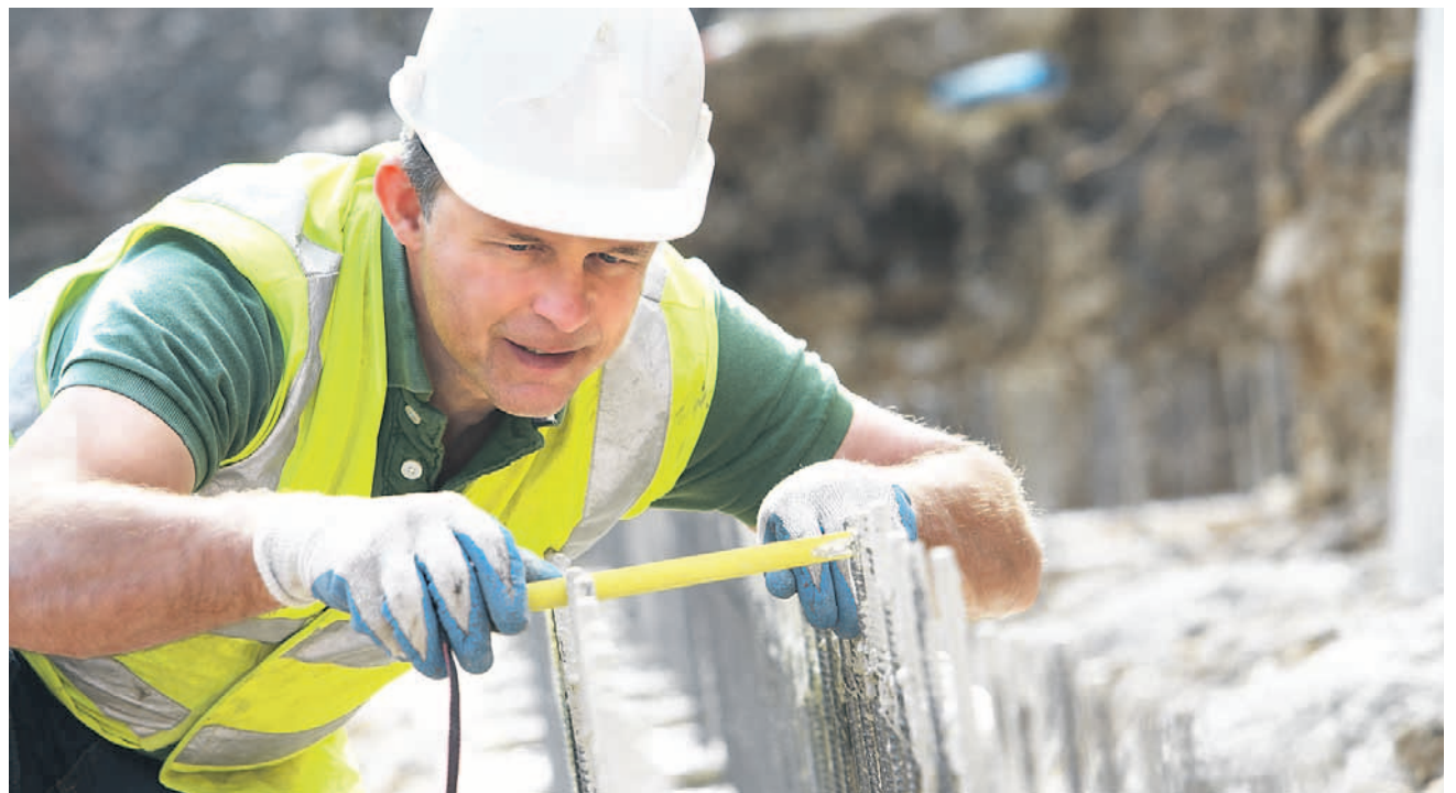
Maß nehmen für Vollbeschäftigung – „Deutschland 2020“ heißt: wirtschaftlich leistungsfähig, sozial gerecht, ökologisch nachhaltig.

Die SPD-Bundestagsfraktion hat die Alternativen zur Chaospolitik der schwarz-gelben Regierung. In ihrem Arbeitsprogramm „Deutschland 2020“ zeigt sie: Vollbeschäftigung ist machbar. Stillstand, Streitigkeiten in der Koalition und eine Politik, die die soziale Spaltung im Lande vorantreibt: Schwarz-Gelb ist bereits nach 15 Monaten Regierungsverantwortung am Ende und nicht in der Lage, die drängenden politischen Herausforderungen zu meistern. Anders die SPD-Bundestagsfraktion: Unter dem Titel „Deutschland 2020 – Vollbeschäftigung, Fortschritt, Lebensqualität im neuen Jahrzehnt“ hat sie auf ihrer Klausur Mitte Januar ein umfassendes und nachhaltiges Arbeitsprogramm für das kommende Jahrzehnt vorgelegt. „2011 wird das Jahr einer neuen Profilierung der SPD“, erklärt Frank-Walter Steinmeier, Vorsitzender der SPD-Bundestagsfraktion. „Wir haben uns vorgenommen, unsere sozialdemokratischen Alternativen zu Schwarz-Gelb noch stärker ins Zentrum der politischen Auseinandersetzung zu rücken und die Menschen von unseren Positionen zu überzeugen.“ Leitbild von „Deutschland 2020“ ist eine neue