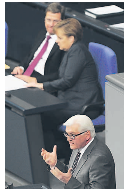
Steinmeier: „Ich bin mir jedenfalls nach dem Desaster der ersten 15 Monate von Schwarz-Gelb sicher, dass es eine Fortsetzung dieser Koalition nicht geben wird.“

Wer Armut bekämpfen will, sollte nicht erst dann damit anfangen, wenn sie schon entstanden ist. Deshalb gehört es für uns dazu, Kindern aus sozial schwächeren Familien bessere Bildungschancen schon in der Schule zu verschaffen. Denn nur wer gut ausgebildet ist, kann später gute Arbeit finden und für sich selber sorgen. Und wenn wir wollen, dass diejenigen die Arbeit finden, auch davon leben können und nicht zum Amt gehen müssen, dann brauchen wir Min-