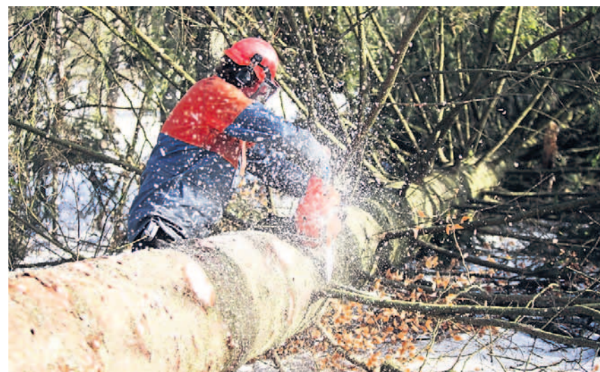
In der Forstwirtschaft, der Landwirtschaft und im Gartenbau gilt die Arbeitnehmerfreizügigkeit in Deutschland bereits seit dem 1. Januar 2011 – für alle anderen Branchen ab dem 1. Mai.

Weiteres Problem: Auch grenzüberschreitende Arbeitnehmerüberlassung – also Leiharbeit – ist ab dem 1. Mai