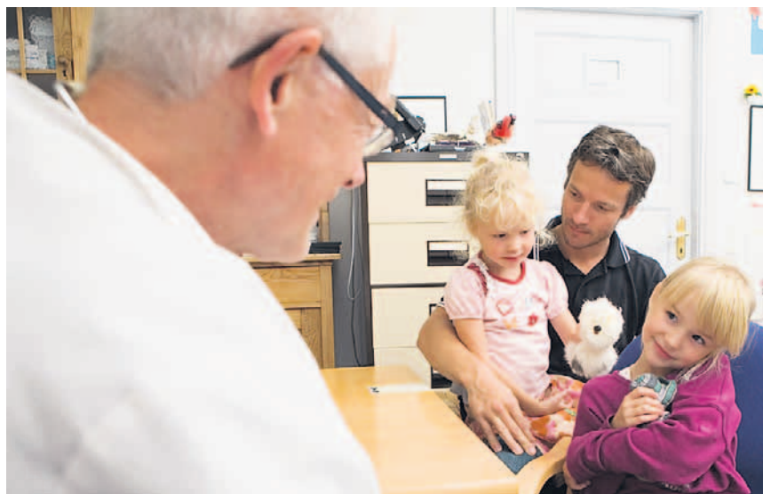
Solidarität von allen, Gesundheit und gute Leistungen für alle – das ist die Bürgerversicherung, wie sie sich die SPD-Bundestagsfraktion vorstellt.

Die SPD-Bundestagsfraktion setzt sich für solidarische und gerechte Alternativen zur Kopfpauschale ein