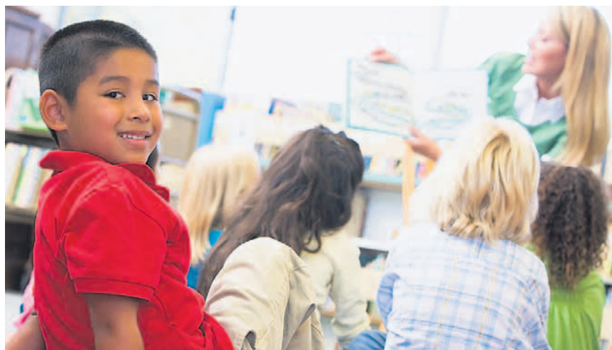
Kürzungen in der frühkindlichen Bildung haben fatale Folgen für Integration.

Integration ist eine soziale Frage. So sind die Probleme von alleinerziehenden Müttern ohne Schulabschluss die gleichen – unabhängig von ihrer ethnischen Herkunft. Mangelnde Bildung, Arbeitslosigkeit und Armut grenzen aus. Integration bedeutet dagegen Teilhabe und Chancengleichheit. Deshalb ist Integration am Arbeitsplatz ein wichtiger Schritt zur gleichberechtig-