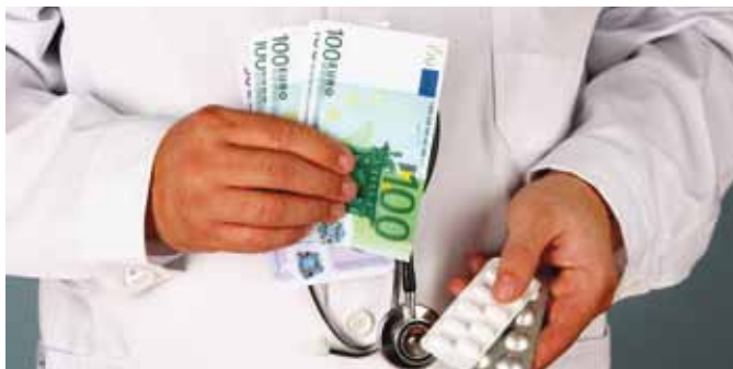
Von der schwarz-gelben Gesundheitspolitik profitieren Pharmakonzerne, Ärzte, Apotheker, Arbeitgeber und Besserverdienende.

Ab 2011 steigen die Beitragssätze der gesetzlichen Krankenversicherung (GKV) um 0,6 Prozent. Sie betragen dann 15,5 Prozent. Davon zahlen die Beschäftigten 8,2 Prozent und ihre Arbeitgeber 7,3 Prozent. Der Arbeitgeberanteil wird eingefroren. Das heißt, alle künftigen Kostensteigerungen landen allein bei Beschäftigten, Studierenden sowie Rentnerinnen und Rentnern. Damit wird niemand mehr an der Seite der gesetzlich Krankenversicherten mit auf die Kostenbremse treten, um die Ausgaben zu begrenzen. Die Versicherten sind dann allein dem finanziellen Druck einzelner Leistungserbringer wie z. B. Pharmakonzernen und Teilen der Ärzteschaft ausgeliefert.