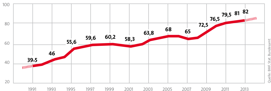
Schuldenstand im Verhältnis zum BIP in %