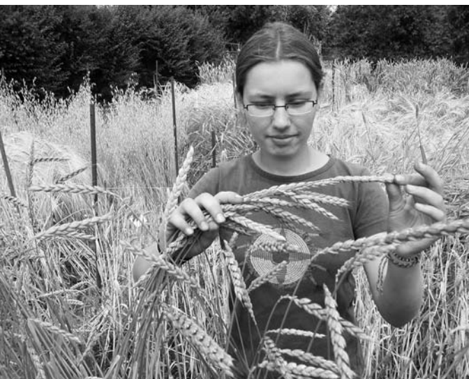
Freiwilliges Ökologisches Jahr in einer Schaugärtnerei

Jugendfreiwilligendienste sind seit Jahrzehnten ein Erfolgsmodell. Sie werden von den jungen Menschen stark nachgefragt: Auf einen Platz kommen im Durchschnitt drei Bewerberinnen und Bewerber. Daher fordert die SPD-Bundestagsfraktion den Ausbau der Jugendfreiwilligendienste, denn in den Freiwilligendiensten liegt die Zukunft.